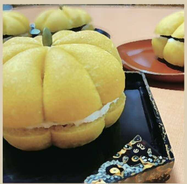
▲ハロウィンにかぼちゃパンを作りました！クリームチーズと粒あんを挟んで。今回はかぼちゃパウダー使用。見た目もお味も◎！即無くなりました☆