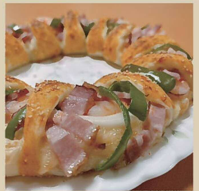
▲ピザパン。成形が楽しかったです♡ピザなのかパンなのか…。(笑)中の具は色々お好みで変えられますよ〜*.*

編集後記 社員一同、脳をフル回転させながら日々仕事に取り組んでおりますが、三歳の娘の柔らかい脳には毎度感心させられます。娘は濱の湯が大好きで、先日も家族で行った時のこと。ロッカー内にあるハンガーのフック部分を指差し、「なんでここがクルクル回るん？」と訊ねてきました。(ついに始まったかなぜなせ期☆と思いながら)大人になった今、そのような事を考えながら生活をしていないためすぐに答えることができず、「どっちからもかけられないようにかなあ？」とよくわからない返事をしてしまいました。幼い子の着眼点は素晴らしいと感じました。何事にも好奇心を持つことで、様々な気づきもあり、お仕事でもお客様へのご提案の幅が広がるのではないかと感じました。この子の脳を私にも分けて欲しい...と無い物ねだりをする母でありました。(笑)今年も大変お世話になりました。コロナ禍でなにかと歯がゆい1年を過ごされたかと思えます。マスク生活が日常になりつつありますが、いつかマスクを外し、皆さんとお顔を合わせて笑い合える日常が1日でも早く戻ることを願っています。皆様、佳いお年をお迎えください。